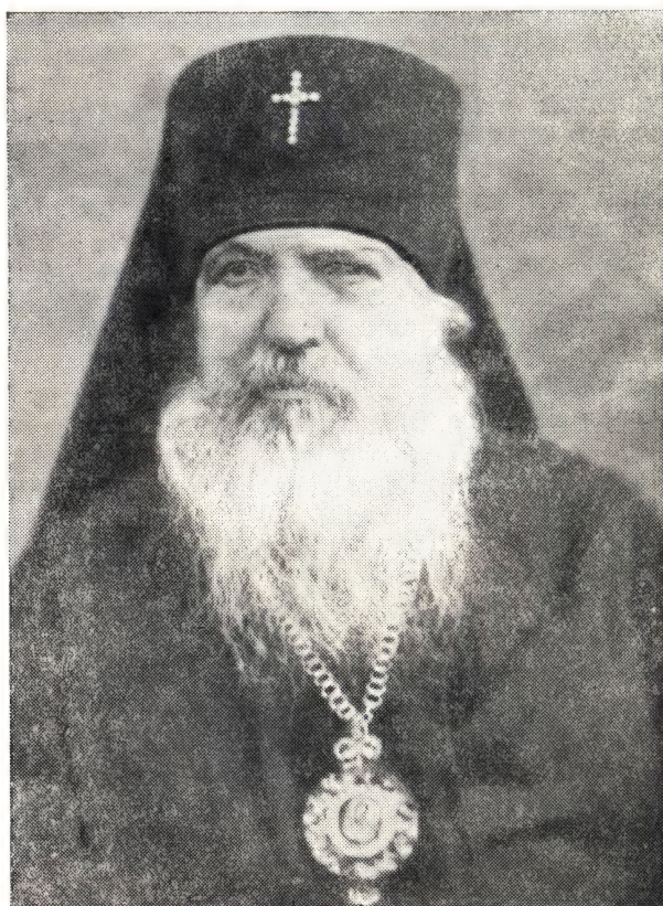
АЛЕКСИЙ, АРХИЕПИСКОП КУЙБЫШЕВСКИЙ И СЫЗРАНСКИЙ

В конце апреля текущего года исполнилось 25 лет архиерейского служения Преосвященного архиепископа Куйбышевского и Сызранского